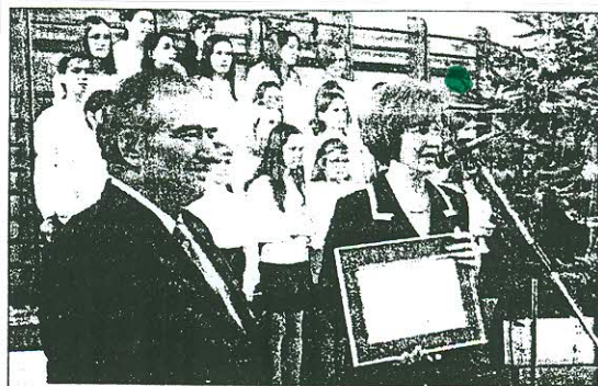
Ajándék az oktatáshoz. Másfél millió forint értékben kapott számítógépet, elektronikus és nyomtatott oktatási anyagokat a miskolci Soltész Nagy Kálmán Általános Iskola pénteken a Citigroup Alapítvány jóvoltából. Az iskolát a Citibank iskolatámogatási jótékonyági programja keretében választották be a támogatottak körébe.